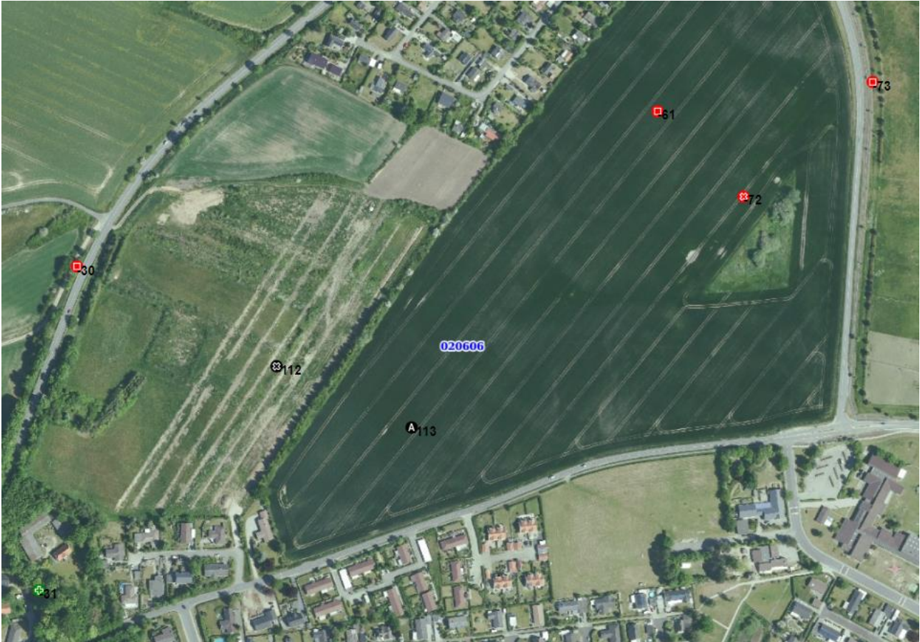
Fig. 2. De i høringsvaret nævnte fortidsminder. Ved nr. 112 ses også søgegrøfterne fra det i 2020 forundersøgte delareal.