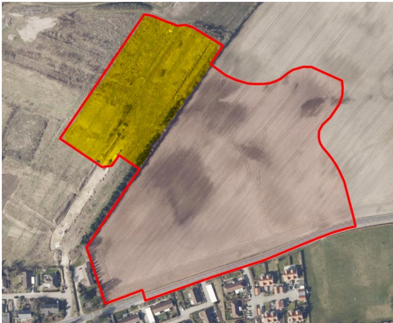
Fig. 1. Planområdet LK 91 Snebærvej Øst. Det delareal, som er arkæologisk undersøgt, er markeret med gul.